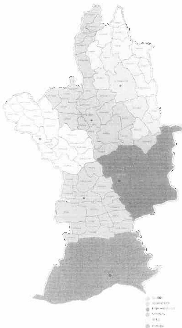
MAPA 19 JUDEȚULUI OLT